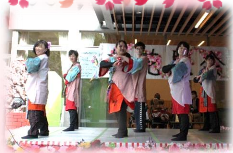
職員による『よっちょれ』