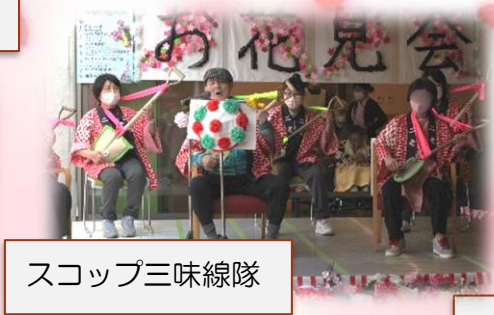
スコップ三味線隊