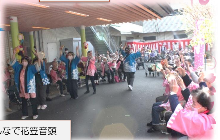
みんなで花笠音頭

満開の桜の中でお花見会を開催する事が出来ました。 職員と入居者様が共同して余興を行い、参加者全員が楽しめるお花見会になりました。